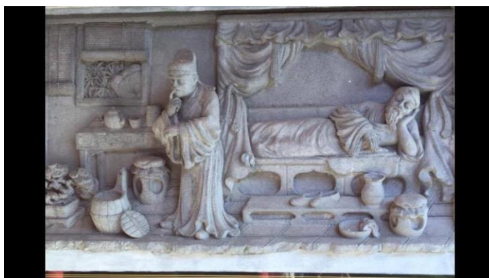
ภาพประกอบ 4 ประติมากรรมนูนสูงเรื่อง ชิมอุจจาระบิดา