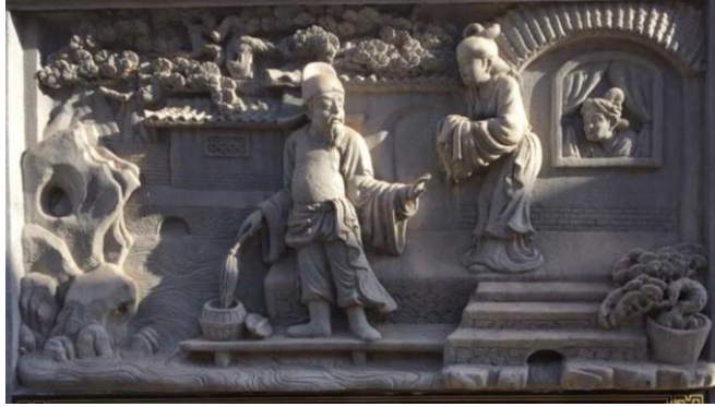
ภาพประกอบ 3 การแต่งกายสมัยฮั่น

จากตัวอย่างประติมากรรมนูนสูงที่ยกมาจะเห็นว่าได้มีการสื่อความหมายทางวัฒนธรรมในเรื่องของการแต่งกายได้เป็นอย่างดี เพราะการแต่งกายเป็นเครื่องมือที่สะท้อนถึงความเป็นเอกลักษณ์ บอกระดับฐานะของบุคคล บ่งบอกถึงระดับชนชั้นในสังคมได้ เพราะฉะนั้นแล้วภาษาที่ปรากฏในภาพประติมากรรมนูนสูงในศุนย์วัฒนธรรมไทย-จีน อุดรธานี ได้สื่อถึงความหลากหลายทางชาติพันธุ์ของคนจีน สื่อถึงเอกลักษณ์และวัฒนธรรมการแต่งกายในแต่ละยุคสมัย สื่อถึงระดับชนชั้นต่างๆ ในสังคมของชาวจีนได้เป็นอย่างดี