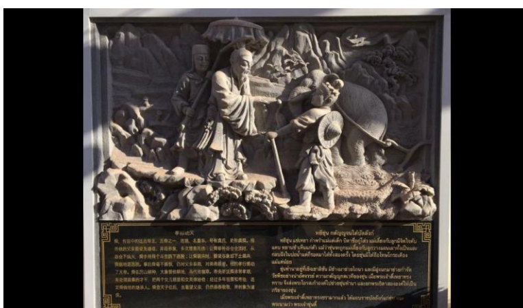
ภาพประกอบ 1 การเขียนบรรยายภาพเป็นภาษาจีน

วัฒนธรรมของจีนมีลักษณะเฉพาะเป็นเอกลักษณ์ของตน การที่วัฒนธรรมของจีนจะสืบทอดลักษณะ และรายละเอียดทั้ง มวลจากอดีตมาถึงปัจจุบัน และจากปัจจุบันที่จะสืบทอดต่อไปในอนาคตได้นั้น ก็ด้วยอาศัยภาษาเป็นเครื่องมือทั้งโดยการบันทึกไว้เป็นลายลักษณ์อักษร และการเล่าจดจำสืบทอดมาจึงมีคำกล่าวที่ว่า ภาษาเป็นหัวใจของวัฒนธรรม ถ้าปราศจากจากหัวใจคือภาษาเสียแล้ว วัฒนธรรมก็สืบทอดไม่ได้และต้องสูญหายไปโดยเร็วขณะที่ภาษาไทยทำหน้าที่สืบทอดวัฒนธรรมไทยนั้น ภาษาไทยยังมีความสำคัญอย่างยิ่งในแง่เป็นเครื่องสื่อความหมายทางวัฒนธรรมด้วย ในภาพประติมากรรมนูนสูงในศูนย์วัฒนธรรมไทย-จีน อุดรธานี ได้ปรากฏการสื่อความหมายทางด้านวัฒนธรรมในด้านภาษาโดยจะพบว่า ทุกภาพจะมีการเขียนคำบรรยายเป็นภาษาจีนเพื่ออธิบายเรื่องราวและสื่อความหมายใต้ภาพทุกภาพ