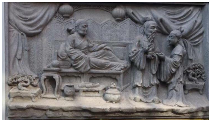
ภาพประกอบ 2 การแต่งกายสมัยช่งหรือซ่ง

วัฒนธรรมเสื้อผ้าเครื่องแต่งกายของชาวจีนมีมาอย่างยาวนาน โดยชาวจีนได้รับอิทธิพลเครื่องแต่งกายจากชนกลุ่มน้อย เผ่าต่างๆ ในประเทศจีน รวมถึงวัฒนธรรมการแต่งกายเสื้อผ้าของชาวต่างชาติ ผสมผสานกันจนเป็นลักษณะพิเศษของการแต่งกายชาวจีนในยุคต่างๆ ซึ่งการแต่งกายของชาวจีนนั้นมีความเปลี่ยนแปลงอย่างต่อเนื่อง และมีการพัฒนาต่อไปอย่างไม่หยุดยั้งเนื่องจากชนกลุ่มน้อยเผ่าๆ ต่างในประเทศจีนมีอยู่ถึง 42 เปอร์เซ็นต์ของประชากรจีนทั้งหมด วัฒนธรรมการแต่งกายของชาวจีนจึงสามารถแบ่งออกเป็น 2 กลุ่ม ได้แก่ กลุ่มวัฒนธรรมการแต่งกายแต่ละยุคสมัยของชาวจีนและกลุ่มการแต่งกายของชนกลุ่มน้อยต่างๆ ในประเทศจีน ซึ่งมีอยู่ถึง 50 กว่า ชนเผ่า ชนกลุ่มน้อยเหล่านี้มักจะมีการแต่งกายที่มีลักษณะเอกลักษณ์และมักจะไม่มีการเปลี่ยนแปลงไปตามยุคสมัย จากการสำรวจและเก็บข้อมูลจะพบว่า ในประติมากรรมนูนสูงได้สะท้อนถึงวัฒนธรรมการแต่งกายของคนจีนในแต่ละยุคสมัยได้เป็นอย่างดี เช่น ในสมัยช่ง (ค.ศ.960 - ค.ศ.1279) แบบเสื้อผ้ายังคงได้รับอิทธิพลตกทอดมาจากสมัยถัง แต่เนื่องจากสมัยนั้นแนวความคิดปรัชญา(ของสำนักขงจื้อ) เฟื่องฟู พฤติกรรมของผู้คนส่วนใหญ่คล้ายตามแนวคำสอนของท่านขงจื้อ มีรสนิยมชื่นชมในความเป็นธรรมชาติ ส่งผลให้แบบเสื้อผ้าของผู้คนในสมัยช่งไม่เน้นลวดลายสีฉูดฉาด เครื่องแต่งกายเสื้อผ้าของข้าราชการจะเป็นเสื้อคลุมยาว แขนเสื้อใหญ่ สวมหมวกประจำตำแหน่ง มีการแบ่งสีเสื้อผ้าเพื่อบ่งบอกยศตำแหน่ง ในส่วนของเสื้อผ้าสตรี เป็นลักษณะเสื้อคลุมตัวใหญ่และยาว ช่วงคอตรง ผ้าในส่วนรักแร้ทั้งสองข้างตัดแยกออกจากกัน หรือเรียกอีกอย่างหนึ่งว่า “เสื้อกั๊กสมัยช่ง” แบบเสื้อผ้านี้ได้รับความนิยมในหมู่นางสนมในวังและสตรีทั่วไปในสมัยนั้น