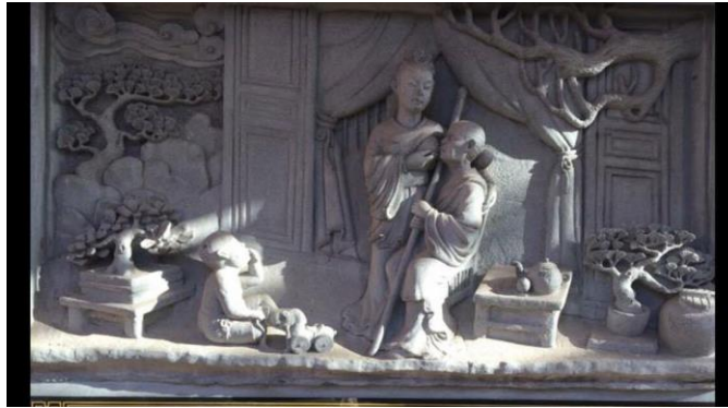
ภาพประกอบ 5 ประติมากรรมนูนสูงเรื่อง น้ำนมน้ำไม่สูญเปล่า