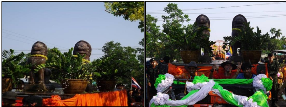
ภาพที่ 9 : ประเพณีแห่เจ้าพ่อสิงห์คู่ของชาวบ้านโคกตาล

ประทีป รัตนพันธ์ (2561: สัมภาษณ์) ได้ให้ข้อมูลว่า ตั้งแต่แยกเขตการปกครองออกมาจากอำเภออุซันต์ คนในพื้นที่ก็ได้มีการปรึกษาร่วมกันว่าจะใช้ชื่ออะไรที่แสดงถึงความเป็นชาวภูสิงห์ ในที่สุดก็ตกลงได้ว่าในพื้นที่มีวัดอุโบสถที่มีมาตั้งแต่อดีตนั่นคือ รูปปั้นสิงห์คู่ที่วัดโคกตาล จากนั้นจึงมีมติร่วมกันว่าเมื่อมีการรูปปั้นสิงห์คู่เป็นชื่ออำเภอแล้ว รูปปั้นสิงห์คู่จะเป็นสัญลักษณ์ของและตัวแทนชาวภูสิงห์ และชาวบ้านก็จะร่วมกันแห่รูปปั้นสิงห์คู่อย่างยิ่งใหญ่ประจำปี