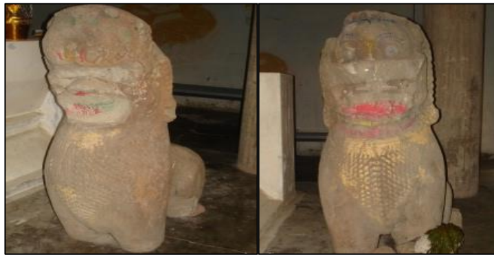
ภาพที่ 3 : ภาพรูปปั้นสิงห์คู่ที่เคลื่อนย้ายมาอยู่วัดโคกตาลครั้งแรก

จากการลงพื้นที่เก็บข้อมูลพบว่า วัดนี้เป็นสถานที่ที่ชาวบ้านได้เข้าไปพบรูปปั้นสิงห์คู่ ซึ่งปัจจุบันได้สร้างศาลปูตาขึ้นแทนที่เพราะรูปปั้นสิงห์คู่ได้ย้ายไปอยู่วัดโคกตาล การสร้างวัดไม่สามารถระบุได้ชัดเจนว่าสร้างขึ้นตั้งแต่เมื่อไร แต่ก็มีหลักฐานจากคนในพื้นที่รวมถึงปราชญ์ชาวบ้านว่าอาจสร้างขึ้นในสมัยอยุธยา ซึ่งอาจเป็นไปได้เพราะในสมัยอยุธยานั้นปรากฏการสร้างสิ่งล้อมรอบสถานที่ศักดิ์สิทธิ์ไว้ เช่น เจดีย์หรือสถานที่ทางศาสนาเอาไว้เป็นอันมาก หรือไม่ก็อาจสร้างขึ้นในสมัยรัตนโกสินทร์ก็ได้ ส่วนการสร้างรูปปั้นสิงห์คู่ของช่างสมัยนั้นอาจต้องการที่จะสร้างสิ่งคู่ตามอิทธิพลความเชื่อที่ได้รับมาจากอาณาจักรขอม โดยเฉพาะการสร้างรูปปั้นสิงห์คู่ไว้ที่หน้าประตูทางเข้าวัดหรือล้อมรอบเจดีย์และสถานที่สำคัญทางศาสนาต่างๆ เมื่อชาวบ้านได้ไปพบจึงเกิดความกลัวว่า รูปปั้นสิงห์คู่นั้นอาจถูกขโมยจึงได้ร่วมมือกันย้ายรูปปั้นสิงห์คู่มายังวัดโคกตาล ต่อมาได้กลายมาเป็นวัตถุโบราณที่มีศักดิ์สิทธิ์และความสำคัญต่อชาวบ้านอย่างมาก เพราะเนื่องจากชาวบ้านได้ให้ความเคารพ ศรัทธา ต่อรูปปั้นสิงห์คู่ ที่สำคัญคือเป็นวัตถุโบราณที่ตกทอดมาอย่างยาวนาน กลายเป็นวัตถุที่มีความศักดิ์สิทธิ์และล้ำค่าที่ชาวบ้านในพื้นที่ต่างกราบไว้บูชา ดังภาพตัวอย่าง