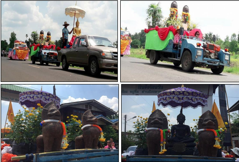
ภาพที่ 8 : การนำรูปปั้นเจ้าพ่อสิ่งหุ้มเข้าร่วมในประเพณีสงกรานต์

เมื่อมีการสร้างที่ประดิษฐานรูปปั้นสิ่งหุ้มภายในวัด ในเวลาต่อมาหลายปีความเชื่อที่มีต่อรูปปั้นสิ่งหุ้มโบราณของชาวบ้านทั้งในและนอกพื้นที่ ก็ทำให้รูปปั้นสิ่งหุ้มที่อยู่ในวัดโคกตาลกลายมาเป็นส่วนหนึ่งของประเพณีประจำปี ซึ่งปรากฏการณ์ดังกล่าวทำให้เห็นถึงแนวคิดสำคัญของชาวบ้านที่พยายามนำวัตถุที่เชื่อว่าเป็นของศักดิ์สิทธิ์โบราณภายในหมู่บ้านมาสร้างสรรค์ (Created) ให้เกิดคุณค่าต่อประเพณีวัฒนธรรมและวิถีชีวิตของตนเอง ดังภาพประกอบ