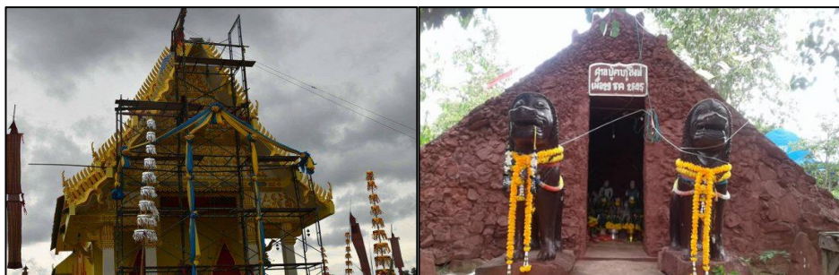
ภาพที่ 2 : วัดถ้าสิงห์คู่ ตำบลโคกตาล อำเภอกุสิงห์ จังหวัดศรีสะเกษ

ทุกคลองแก้ว ซึ่งเป็นหมู่บ้านที่อยู่ติดกันและอยู่ทางทิศเหนือของวัดป่าถ้าสิงห์คู่ ขณะที่บริเวณดังกล่าวมีสภาพเป็นป่าไม้หนาที่บ และบางส่วนของพื้นที่พบมีบ่อน้ำ ซึ่งจากคำบอกเล่าน่าจะเป็นวัดในสมัยก่อน หรือสถานที่ที่คนสมัยก่อนใช้เป็นสถานที่ในการสร้างรูปปั้นสิงห์คู่เพื่อจะนำรูปปั้นสิงห์ไปไว้บริเวณที่มีการพบรอยพระพุทธรูป และอาจจะสร้างเป็นวัดซึ่งอยู่ไม่ห่างไกลมากนัก