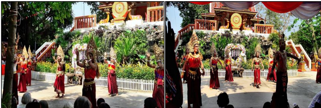
ภาพที่ 8 : การประกอบพิธีรำบวงสรวงเจ้าพ่อสิงห์คู่วัดโคกตาลในทุกปี

การบวงสรวง เป็นอีกหนึ่งพิธีกรรมที่มีมาในสังคมไทยมาอย่างยาวนาน แม้ว่าสังคมจะเปลี่ยนแปลงไปตามยุคสมัย แต่การบวงสรวงก็ยังคงถูกจัดขึ้นเรื่อยมาในทุกพื้นที่ของสังคมไทยจนปัจจุบัน พระครูสิทธิรัตนาวุฒิ (2558:5) ชี้ให้เห็นว่า “การบวงสรวง เป็นการบอกกล่าว การขออนุญาตต่อเทพยดาอารักษ์ที่สถิตอยู่ ณ ที่นั้น ๆ รวมไปถึงบวงสรวงดวงวิญญาณของบุรพชนที่มีเดชมียอำนาจที่สถิตอยู่ที่ตรงนั้นหลายภพหลายชาติ ซึ่งผู้บวงสรวงไม่อาจรู้ได้ว่าวิญญาณอะไรหรือของใครบ้าง แต่ก็เชื่อว่ามีวิญญาณสถิตอยู่ที่นั่น ขณะเดียวกันนี้ มีการขอพร ขอโชคลาภ ให้ได้ในสิ่งที่ตนหวัง เครื่องบวงสรวง จะเป็นสิ่งมีชีวิตที่ตายและสุขแล้ว มีหัวหมู ไข่ต้ม ดอกไม้ แต่ผลไม้จะเป็นผลไม้ที่สดๆ มีการจัดรูปเทียนจำนวนมาก ๆ” สำหรับปรากฏการณ์การบูชารูปปั้นสิ่งคู่สุพิธีกรรมของบ้านโคกตาลยังปรากฏในรูปแบบพิธีกรรมอีกอย่างที่ถูกรวบรวมขึ้นเมื่อปี 2558 บนพื้นฐานฐานของความเชื่อที่มีต่อรูปปั้นสิ่งคู่สุพิธีกรรมซึ่งเป็นลักษณะของความเชื่อที่อิงกับองค์ลึกลับหรือสิ่งศักดิ์สิทธิ์บางอย่างมาใช้ในการสร้างสรรค์ขึ้นเพื่อตอบสนองความรู้สึกของผู้คนในสังคมภายใต้ของการความหวัง ความปรารถนา การขอพร ให้อุดมปลอดภัยในการดำเนินชีวิตดังภาพประกอบ