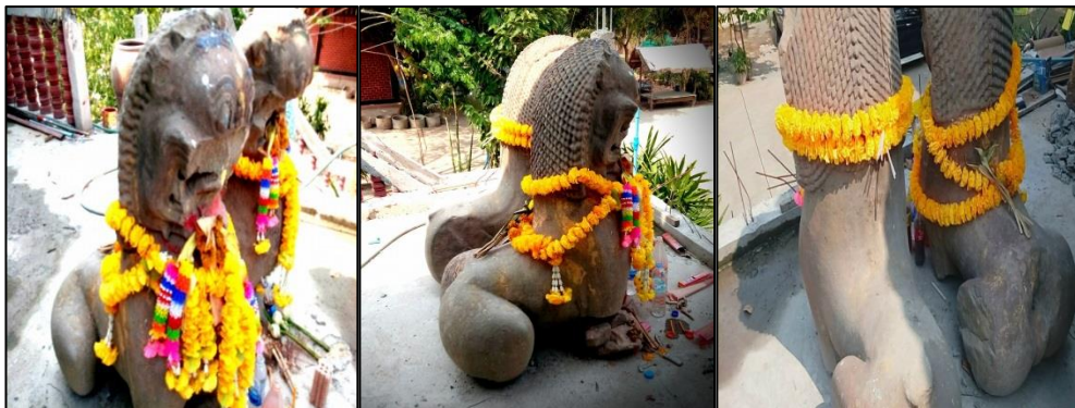
ภาพที่ 4 : รูปปั้นสิ่งหิ้งคู่ที่วัดโคกตาลขณะที่เริ่มสร้างที่ประดิษฐาน

ชานนท์ ไชยทองดี (2557: 27) ชี้ให้เห็นว่า “เรื่องเล่ามีลักษณะเป็นเรื่องเล่าเกี่ยวกับสถานที่ศักดิ์สิทธิ์ที่มีความเกี่ยวข้องกับเรื่องเล่าประจำถิ่นเกี่ยวกับศาสนสถาน และศาสนวัตถุ หมายถึงเรื่องเล่าประจำถิ่นที่กล่าวถึงศาสนสถานในพระพุทธศาสนาที่เป็นที่เคารพบูชา เนื่องจากเป็นสัญลักษณ์ทางพระพุทธศาสนา ” สำหรับเรื่องเล่าเกี่ยวกับรูปปั้นสิ่งหิ้งคู่ที่วัดโคกตาล จากการลงพื้นที่พบว่า มีเรื่องเล่าที่มีความเกี่ยวข้องกับศาสนา คือได้เล่าถึงความศักดิ์สิทธิ์ของรูปปั้นสิ่งหิ้งคู่ตั้งแต่รูปปั้นสิ่งหิ้งคู่ยังไม่ถูกย้ายมาอยู่ที่วัดโคกตาล ชาวบ้านต่างก็เล่าต่อกันมาถึงอำนาจศักดิ์สิทธิ์ของรูปปั้นสิ่งหิ้งคู่