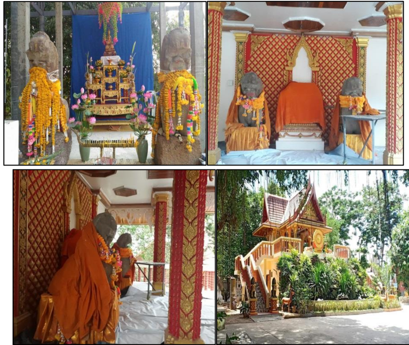
ภาพที่ 7 : เจ้าพ่อสิงห์คู่ที่พิพิธภัณฑ์วัดโคกตาลที่สร้างเสร็จสมบูรณ์

ศก ศรีสิงห์ (2561: สัมภาษณ์) ได้ให้ข้อมูลว่า “หลังจากที่มีชาวบ้านเกิดความศรัทธาต่อรูปปั้นสิงห์คู่ วัดโคกตาลมากขึ้น เพราะได้มีการขอพรและบนบานต่อรูปปั้นสิงห์คู่ในเรื่องที่ปรารถนาและประสบความสำเร็จ เช่น พ่อแม่ไปขอบนบานให้ลูกให้สอบเข้ารับราชการได้ สถานะของรูปปั้นสิงห์คู่ที่เป็นเพียงวัตถุโบราณก็เปลี่ยนแปลงไป เพราะชาวบ้านทั้งในและนอกพื้นที่ก็พากันเรียกรูปปั้นสิงห์คู่ว่า “เจ้าพ่อสิงห์คู่” หรือบางคนก็เรียกว่า “พระยาสิงห์คู่” เลยทำให้รูปปั้นสิงห์คู่เป็นที่รู้จักในด้านของอำนาจศักดิ์สิทธิ์มากขึ้นเรื่อยมาจนถึงปัจจุบัน”